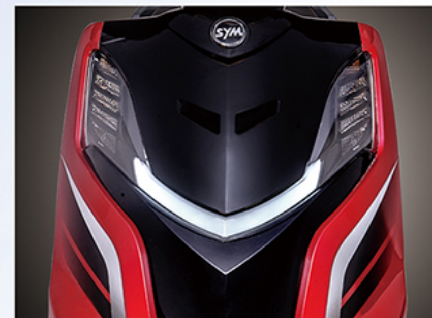
深V型LED灯组: 灯具整合日行灯及方向灯