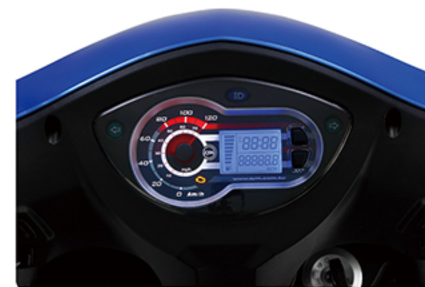
液晶仪表 (仅高配版)