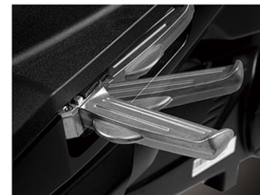
触控式飞旋脚踏: 方便、灵活, 提升后座乘客舒适度