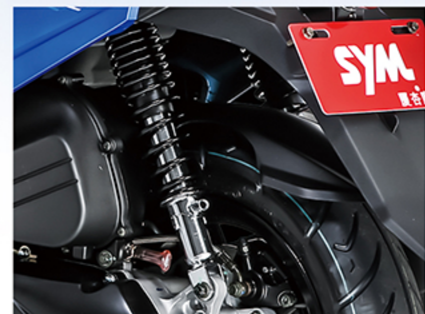
三段可调后双减震 (仅高配版)