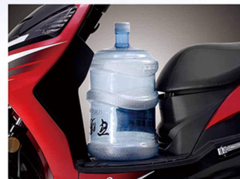
置脚空间: 平踏板, 大空间。置脚、载物都好用