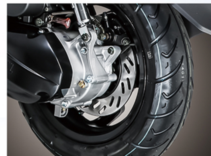
后碟刹 (仅高配版): 220mm超大碟刹盘, 刹车灵敏度高, 效果更好