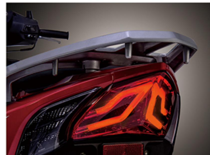
全LED尾灯组: 大面积LED灯具组合, 大气、美观又安全, 更能展现时尚科技与高雅质感