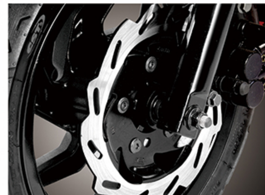
前碟刹: 226mm超大碟刹盘, 刹车灵敏度高, 效果更好