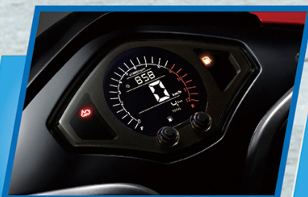
Smart Meter光感应彩色仪表盘